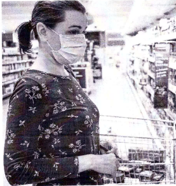
Preços de alimentação foram os que mais subiram no ano, 15,37%, indica Fundação Getúlio Vargas

ÓLEO E CEREAL Os preços dos óleos vegetais deram sequência aos fortes ganhos recentes, saltando 4,7%