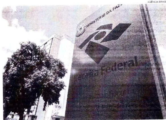
Processo de defesa pode ser feito inteiramente no Centro Virtual de Atendimento da Receita Federal

O e-CAC pode ser acessado de duas formas: pelo certificado digital (espécie de chave eletrônica que custa em média R$ 200) e pela digitação do número do Cadastro de Pessoas Físicas (CPF) e do código de acesso. Caso não tenha código de acesso, o